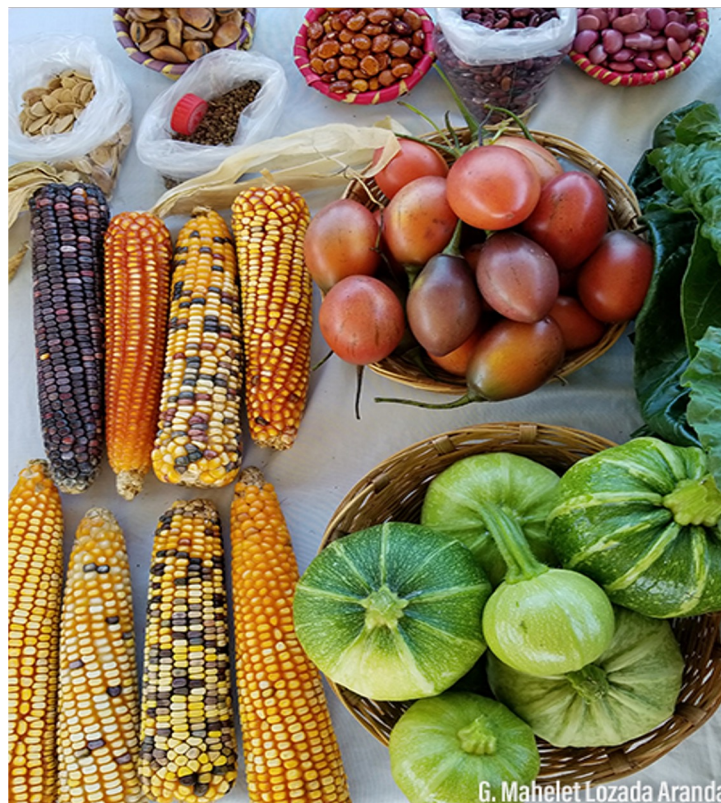
G. Mahelet Lozada Aranda

Las plantas de maíz se combinan, con tomates, chile piquín, chile serrano, chayote, calabaza, frijol zarabanda.